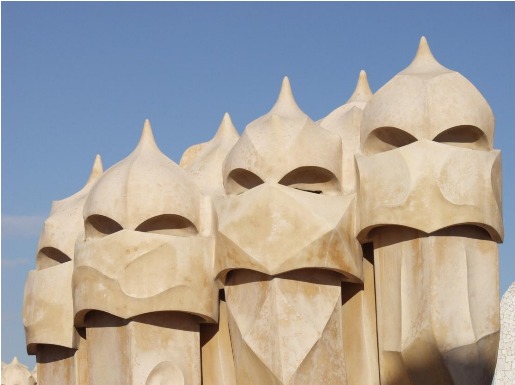
La Pedrera 1910