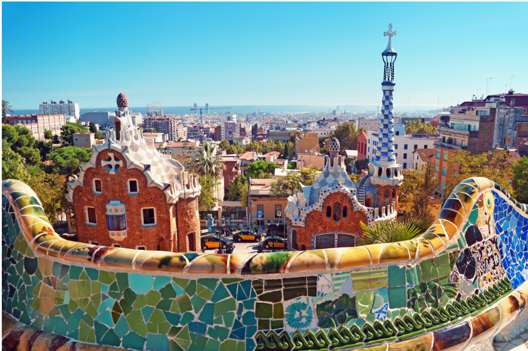
Parc Güell 1914