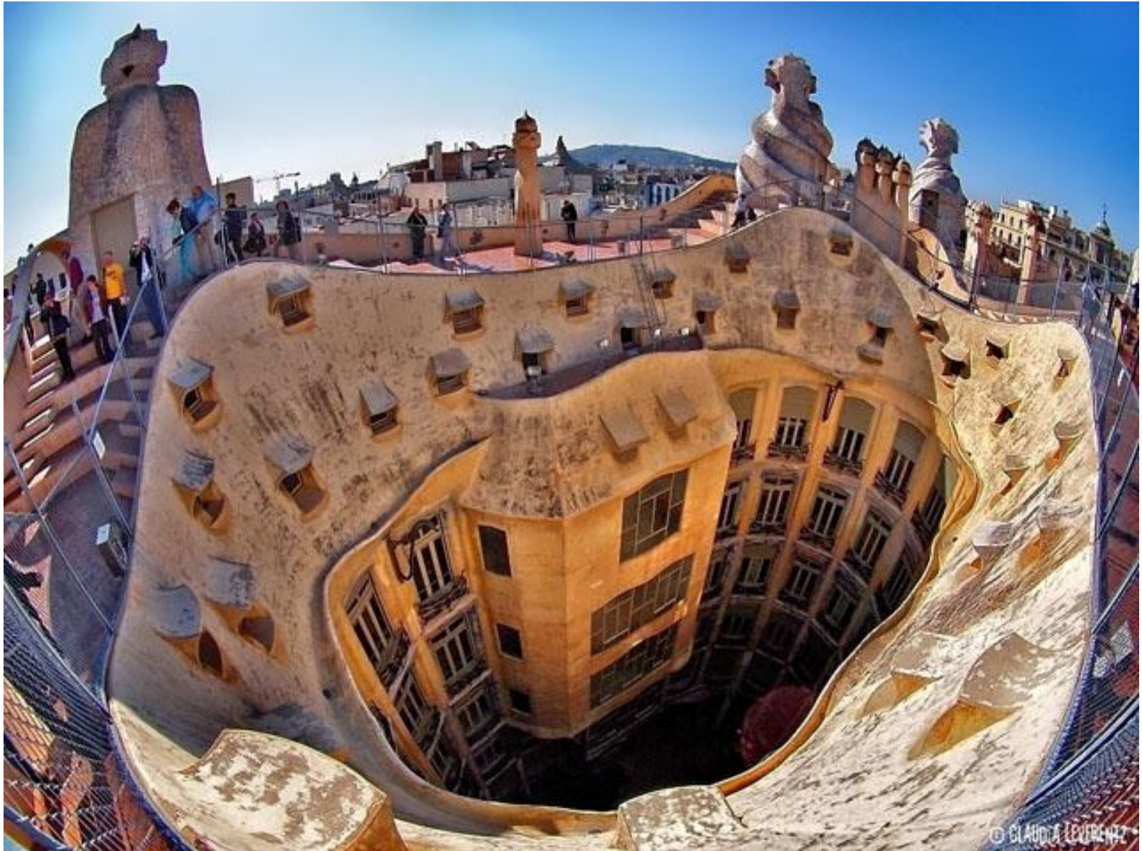
La Pedrera 1910