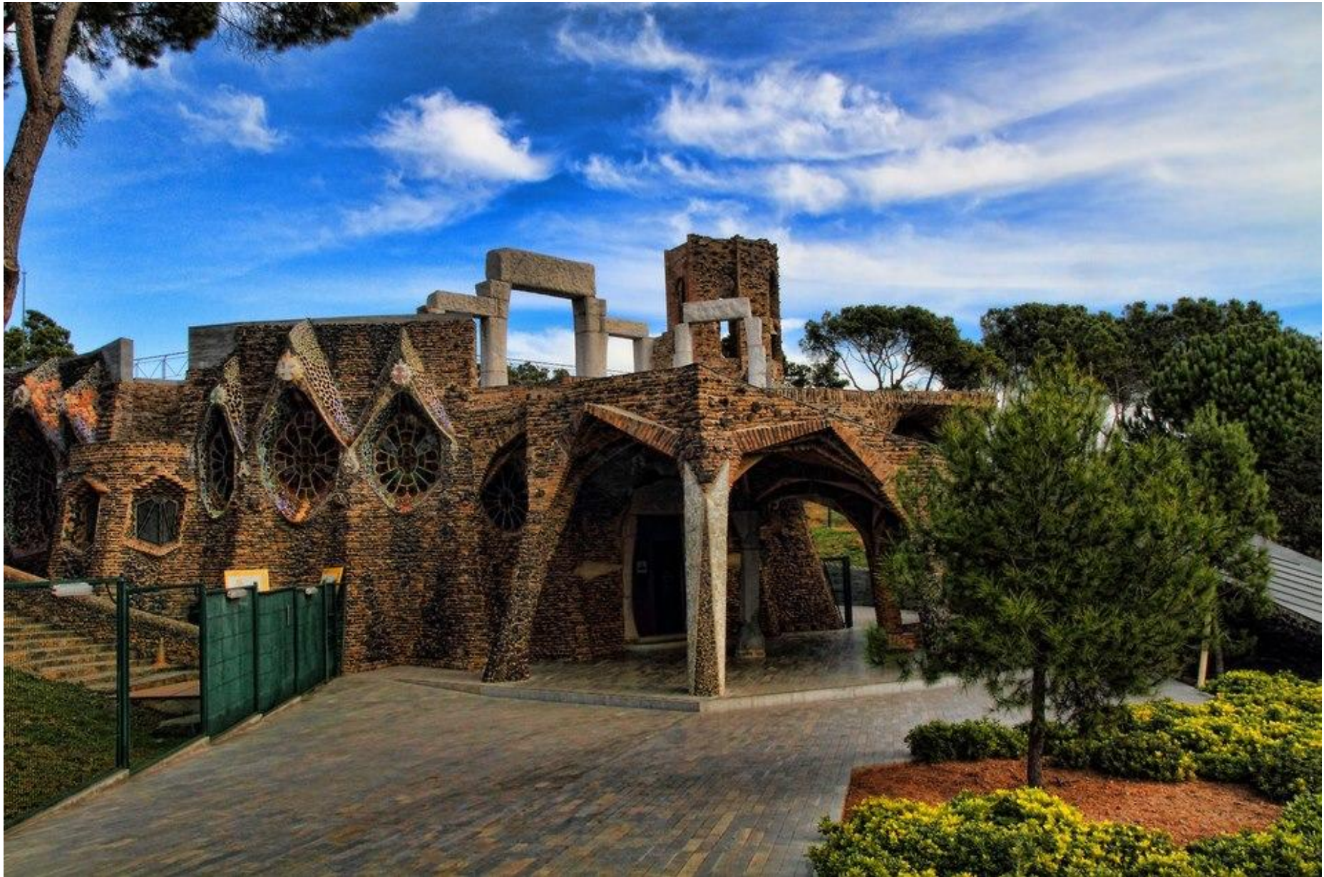
Església de la colònia Güell 1915