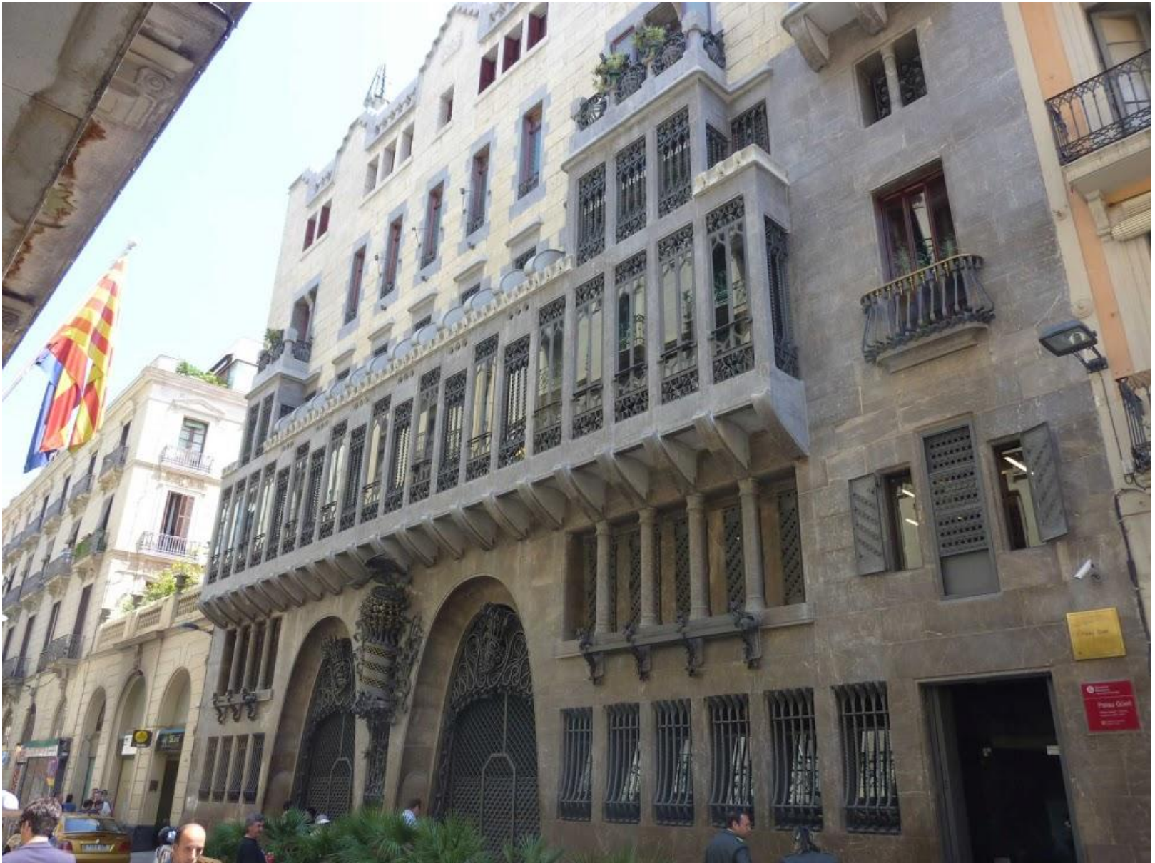
Palau Güell 1900