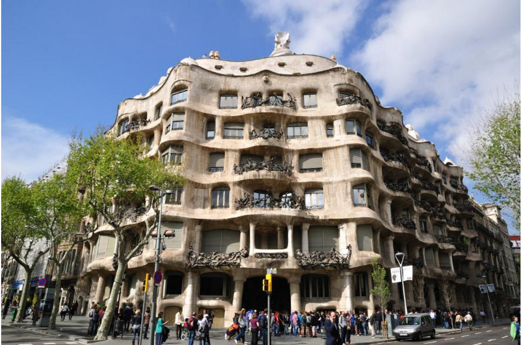
La Pedrera 1910