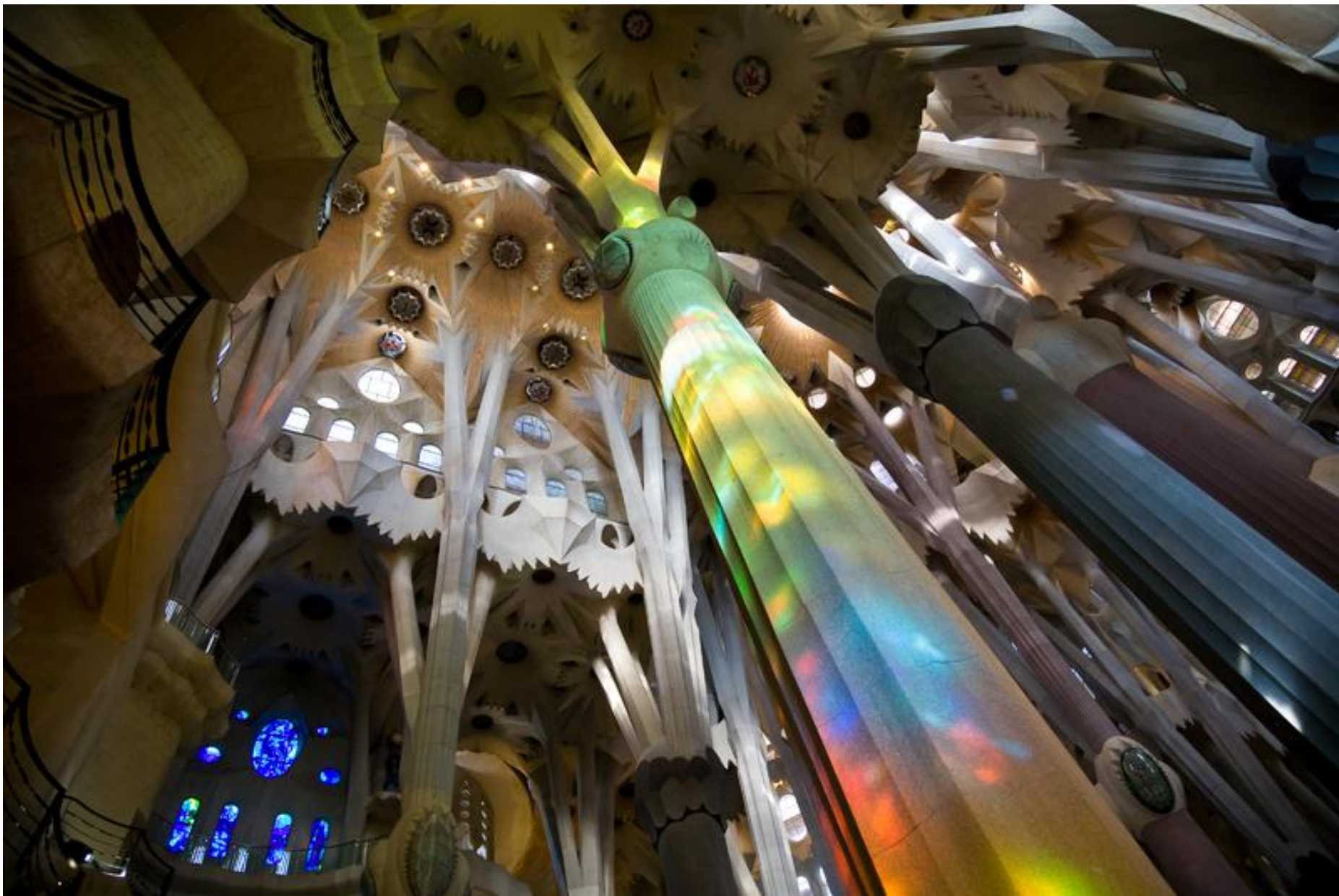
La Sagrada Família (en construcció)