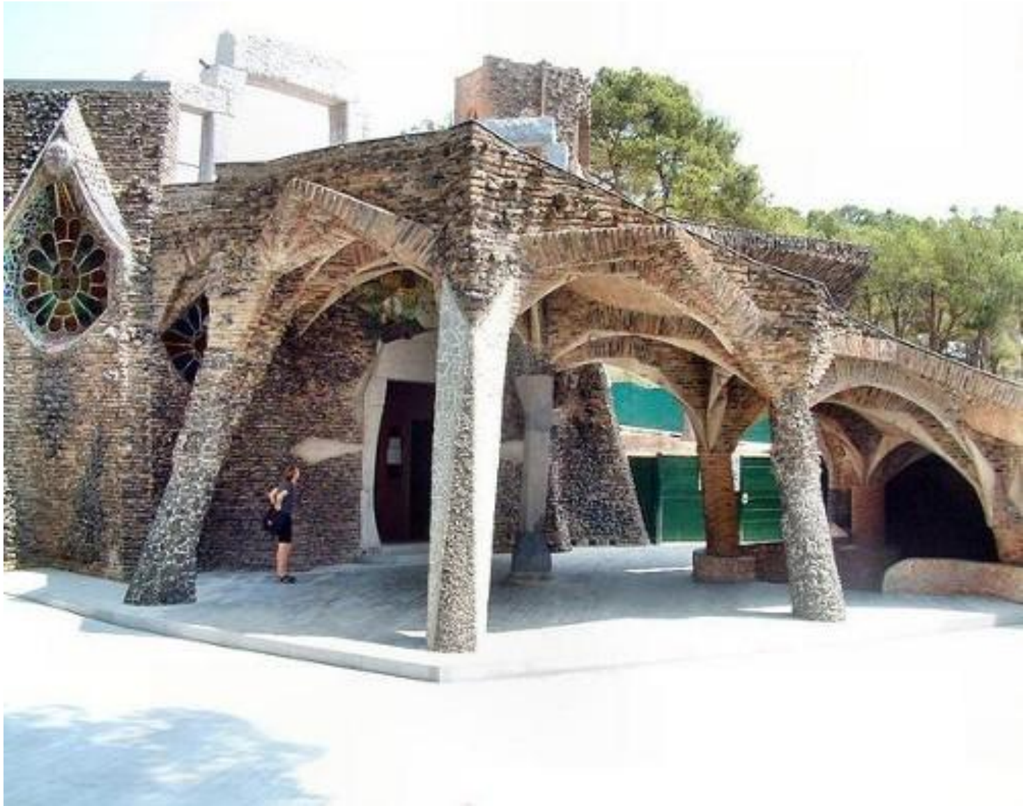
Església de la colònia Güell 1915