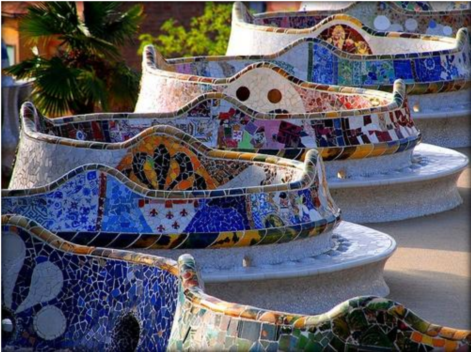
Parc Güell 1914