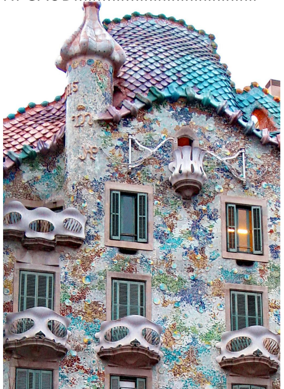
La casa Batlló 1907